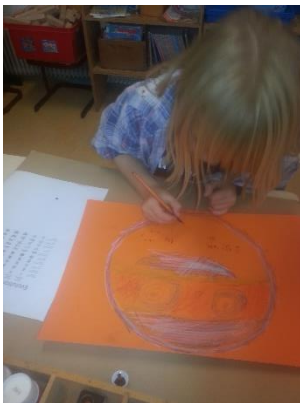
Chinese hoedjes maken

De eerste periode van het schooljaar is alweer voorbij. Wat hebben we al veel met elkaar gedaan en wat hebben we al veel geleerd! Groep 3 heeft al veel letters leren schrijven en veel woordjes leren lezen. Ook het rekenen gaat ontzettend goed, zo hebben ze al geleerd om cijfers te koppelen aan een aantal en aan een plaatje. Ook hebben ze geleerd hoe een getallenlijn eruitziet. Groep 4 heeft kennis gemaakt met Snappet. We moesten er een beetje aan wennen, maar nu gaat het ontzettend goed! Ook heeft groep 4 kennis gemaakt met Taal op maat, waarbij ze moeten werken in een lesboek, een werkboek en een schrift. Ook begrijpend lezen staat vanaf groep 4 op het programma. Ze werken allemaal heel serieus en heel hard, kanjers! Met "Alles-in-1" hebben we veel geknutseld. Zo hebben we Afrikaanse dieren geschilderd, Chinese hoedjes geknutseld, Chinese tekens geschreven met Oost Indische inkt, Chinese waaiers en kijkdozen gemaakt. Vandaag hebben we het thema afgesloten met een inloopmiddag; alle groepen namen een kijkje bij elkaar. Het was een gezellige middag. Fijne herfstvakantie allemaal!